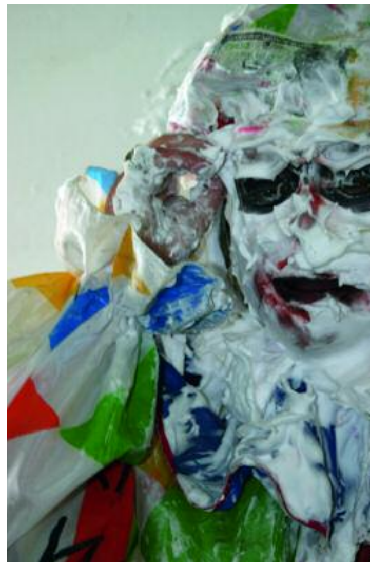
Paul Sakoilsky, Performance, 2007, C-Print, 90 x 60 cm