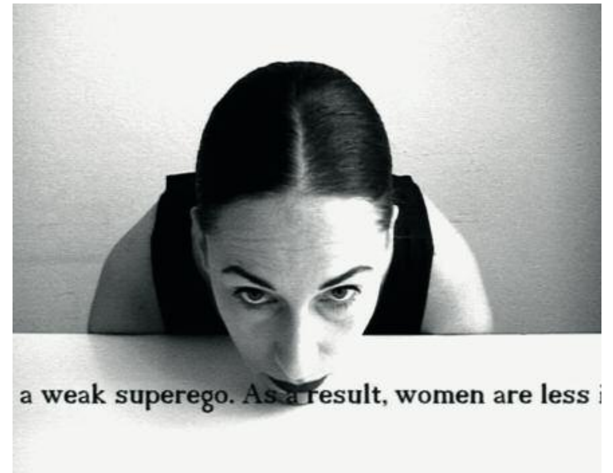
Evelin Stermitz, Strukturen Modell, Videostill, 2006, digitaler C-Print auf Fotopapier, 25 x 20 cm