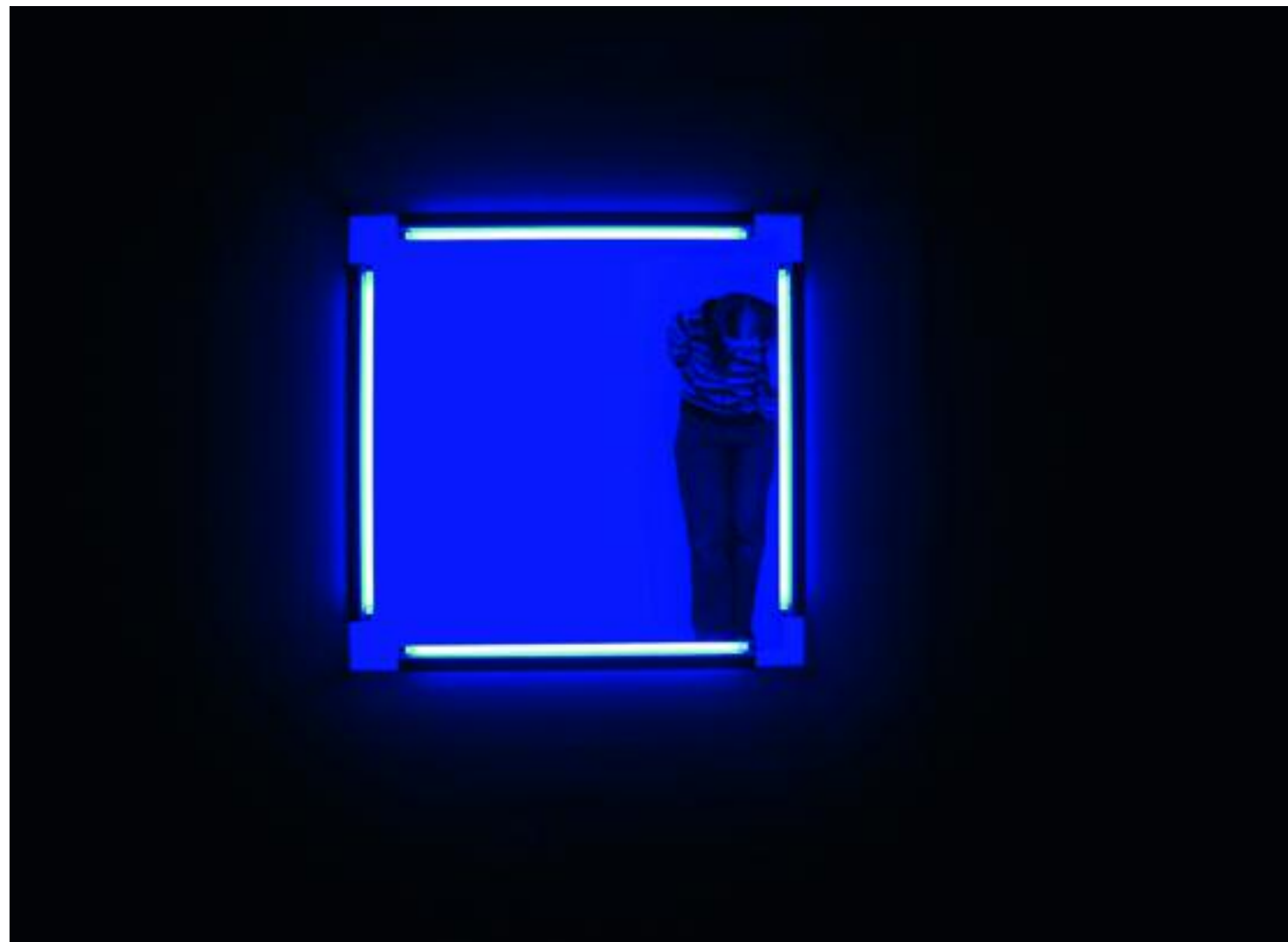
Mouny R. P. Zentara, Dreamland 1, 2008, Lambda print, 60 x 90 cm