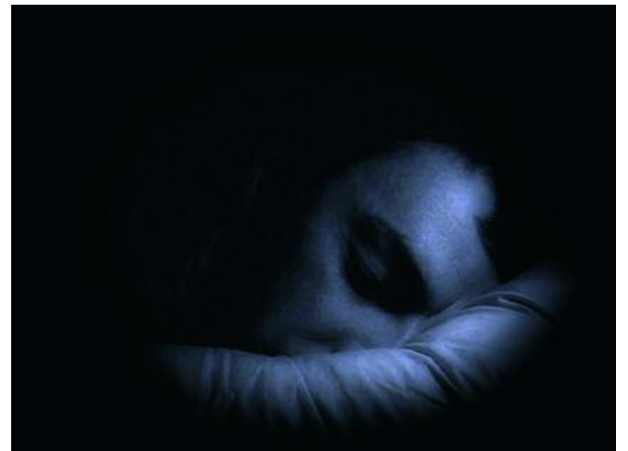
Derek Ogbourne, Gravity + Others, Videostill, 2006